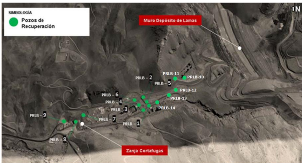
Figura 4-3: Distribución de pozos de recuperación de aguas infiltradas (PRLB – 01 a PRLB – 14).

Fuente: Archivo adjunto a la Carta MLCC VPSAC N°26/2018, de fecha 05 de marzo de 2018, mediante la cual se entrega respuesta a la información requerida en Acta de Inspección Ambiental de fecha 15 de febrero de 2018, que derivó en el Informe de Fiscalización Ambiental DFZ-2018-915-III-RCA-IA (Solicitud de información N°3: Informe de seguimiento del control de infiltraciones y eficiencia de remediación en quebrada La Brea y Caserones).